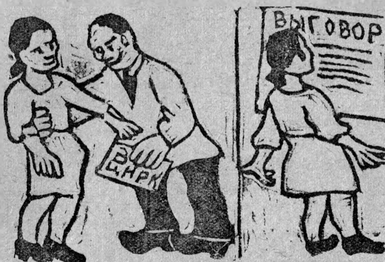
ПЛОДЫ СКОРЫНИНСКОЙ ЛЮБВИ

В заявлении работницы написали: „Наше терпение лопнуло